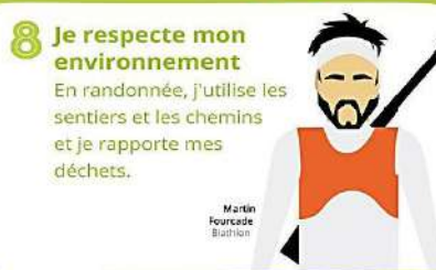
Martin Fourcade Biathlon

J'évite d'acheter des produits jetables ou emballés individuellement et je trie mes déchets pour leur recyclage.