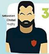
Sébastien Chabal Rugby

Je privilégie un équipement de qualité et je l'entretiens pour prolonger sa durée de vie.