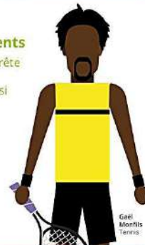
Gael Monfis Tennis