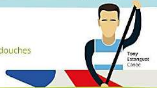
Tony Estrangues Canoë

Je fais attention à ma consommation d'eau lors des douches ou pour nettoyer le matériel, j'éteins les lumières.