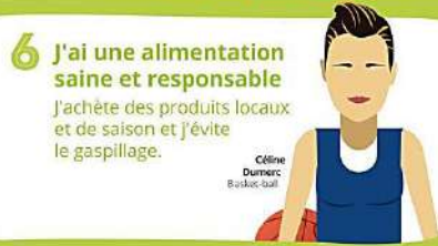
Céline Dumerc Basket-ball

Je l'offre, je le revends ou je le recycle.