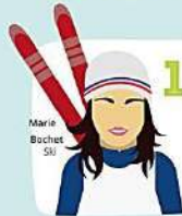
Marie Bochet Ski