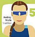
Audrey Morle Triathlon